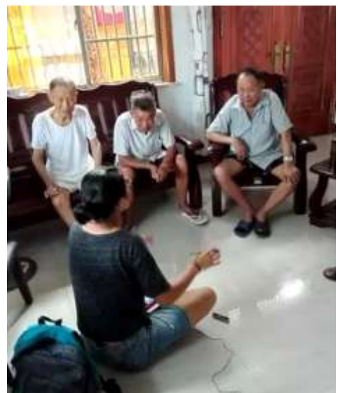
2016年，“共和国基层经济史访谈”项目中，访员与受访者交流

逻辑说事情，转向用数字讲故事。当时，要在数据上做到突破是很困难的，而现代经济又非常需要精确的数据，非常缺乏数据。赵耀辉试图去填补这空白，最开始，这方面只是“星星之火”，赵耀辉手把手教学生如何去做数据，带出了一批能够做数量分析的人，为之后的经济研究奠定了坚实的基础。只待星星之火燎原之日，而今，正当其时。