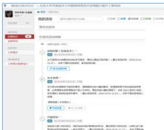
图 8 北京大学信息技术项目实施平台

设计开发了“信息技术应用能力提升工程”项目实施平台，为学习者参与信息技术能力水平的前测诊断、课程推送与选课、研修活动的参与分享、实践活动的展示与评比提供了平台支持。