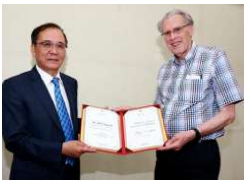
约翰·霍普克罗夫特（右）

约翰·霍普克罗夫特（John Edward Hopcroft），现任北京大学访问讲席教授、前沿计算研究中心主任，康奈尔大学计算机科学系工程与应用数学 IBM 讲席教授。1961 年，在西雅图大学获电子工程学士学位；1962、1964 年，在斯坦福大学分别获电子工程硕士和博士学位。1986 年，由于在数据结构和算法设计与分析领域的基础性贡献被授予图灵奖（A. M. Turing Award）。1987、1989、2009 年，先后当选美国艺术与科学院、美国国家工程院和美国国家科学院院士；2010 年，被聘为中国科学院爱因斯坦讲席教授。近年来，他致力于中国计算机科学与技术的人才培养体系改革；今年 5 月受聘北京大学访问讲席教授后，主持建设北京大学前沿计算研究中心并开设首届“图灵班”，为践行北大在相关领域培养拔尖人才和吸引高层次