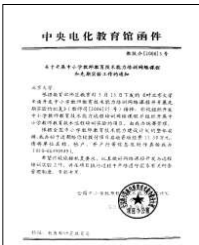
图 1 北京大学获得的教育部立项批文、项目办批文