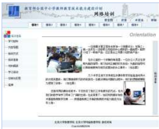
图 6 北京大学教育技术网络课程各模块活动设计

每个时间段内对应的学习模块均有相应的教学过程设计，包含学习目标、内容导图、阅读、案例分析、学习活动、总结与反思、延伸 8 个组成部分，在始终体现以学习者为中心的前提下，教师对教学环节的引领以及对教学过程的控制贯穿整个学习和培训的始终。