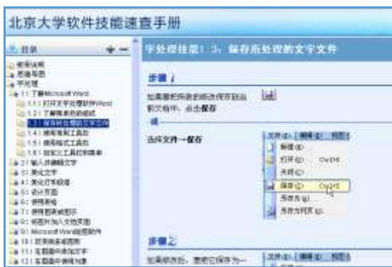
图4 北京大学软件技能速查手册（实用技能手册）