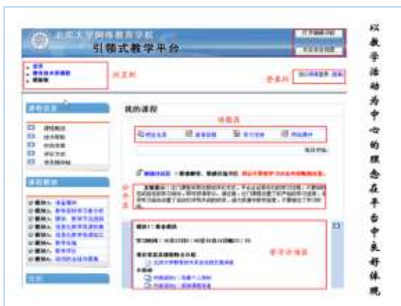
图2 北京大学引领式教学平台

参与的，既注重前期的教学设计，也重视学习过程的参与。课程以教师设计好的学习任务为主线，学习过程多采用讨论、答疑等交互手段，较少运用大量的课件内容，课程设计以促进学员之间的沟通与协作为出发点。与自主式学习模式课程注重内容不同，引领式学习模式强调如何引导学习者充分利用多样化的学习资源以及如何在在学习上给予支持。