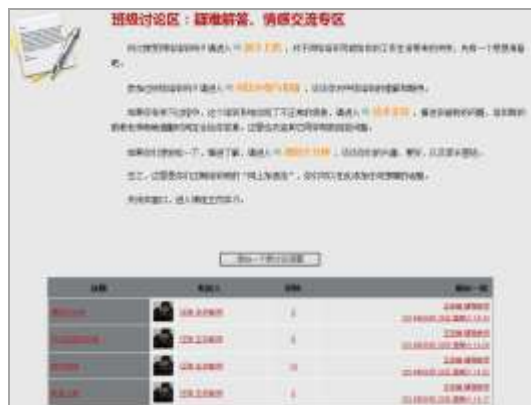
图5 北京大学教育技术培训教师引领活动