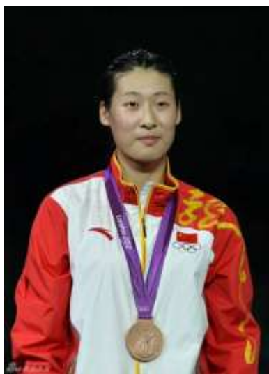
孙玉洁收获伦敦奥运会女子重剑项目团体金牌

2001年，北京申奥成功，万里长城上挤满了从全国各地赶来见证并庆祝这一时刻的人们。人群中，一个小女孩对着记者采访的镜头毫不怯色地说了一句：“我以后要争当奥运冠军！”11年后，在伦敦奥运会的赛场上，中国女子重剑队斩获了我国第一枚女子重剑奥运会金牌和第一枚女子重剑个人赛铜牌，一举突破两项中国女子重剑史！同时将两枚奖牌收入囊中的，正是当年面对镜头的那个女孩：孙玉洁。昔日壮志，终成现实。