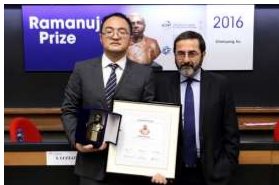
2016年在ICTP领取拉马努金奖，和ICTP主席Fernando Quevedo合影