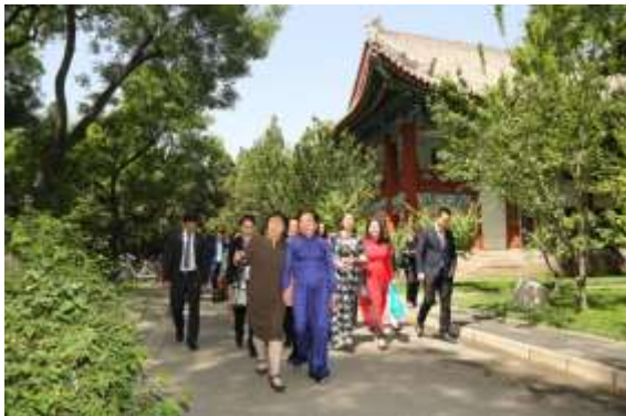
主席夫人一行参观北大校园

越南国家主席夫人阮氏贤女士此次来访将大力推动北大与越南高校及学术机构之间的交流，进一步促进中越友好关系，并推动两国之间教育、科研及文化交