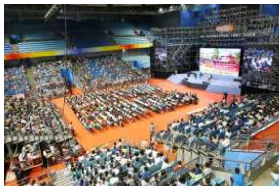
招生信息发布会现场全景

师，以及四名学生代表参加发布会并发言。发布会主要围绕北京大学本科教育综合改革、学院创新人才培养理念与实践、通识教育和专业教育模式等方面进行了情况介绍。