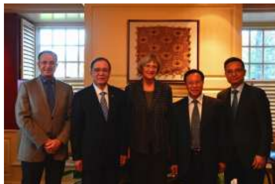
林建华到访哈佛大学并与校长 Drew Faust 会面

9日上午，林建华与哈佛大学校长 Drew Faust 举行会面。林建华回顾了两校合作历史，并指出双方在城市化发展、环境和气候变化、历史大数据等具体领域取得了丰硕的学术成果，希望在医学、国别区域研究领域开展进一步合作。Drew Faust 对林建华再次到访哈佛大学表示欢迎，并表示乐于见到两校在各领域的合作进展顺利，期待未来两校间合作取得更大成果。