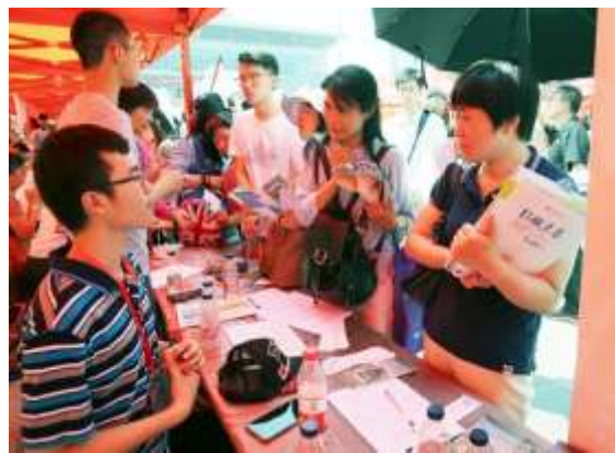
考生和家长在现场咨询

和家长；北大校本部招收本科生的五大学部共计 26 个院系和医学部 5 个学院纷纷设点；涵盖教务部、校团委、资助中心、就业服务中心在内的 10 个校内职能部门也开放咨询。同时，复旦大学、上海交通大学、北京师范大学、南京大学、香港大学、香港中文大学等 30 多所内地和香港的高校也在咨询会布展，对考生和家长关心的 2017 年招生政策、专业选择、教学培养、国际交流、助学体系、校园文化活动、就业情况等问题进行现场解答，多对一深入沟通。未能到达现场的家长和考生，还可以与北大招办的工作人员进行线上互动，向招生办官方微博和官方微信留言，问题由相关领域的专业人士实时解答。