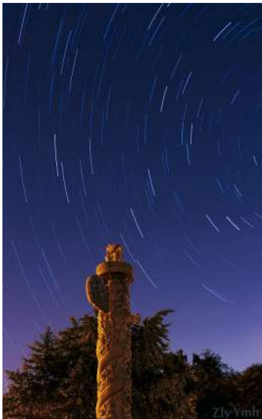
岳明昊拍摄的华表与周日运动