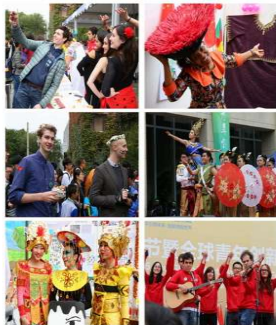
现场丰富多彩的活动

本次国际文化节还与全球青年创新节深度结合，开展了一系列与青年创新创业息息相关的活动。除设立由 30 余支国内外团队推出的“iCAN-Xtecher 看见未来”创新科技体验区外，当天下午和晚上，还邀请国内外知名专家和创投人士一起举行“全球青年创新领袖峰会”和“全球青年创新之夜”。