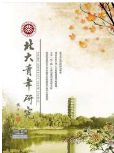
《北大青年研究》封面

近日，《北大青年研究》2015年第3期（总第43期）顺利出刊，共推出10个专题，26篇文章。本期杂志延续当期专题与常设专题相结合，在持续关注大学建设发展和育人工作的同时，聚焦当下时事与理论热点。2015年是新文化运动一百周年，北京大学是新文化运动的主阵地，本期围绕新文化运动这条主线，以大学文化建设为切入点，聚焦新时期大学建设与青年培育，推出了一批兼具理论价值和实践意义的文章。