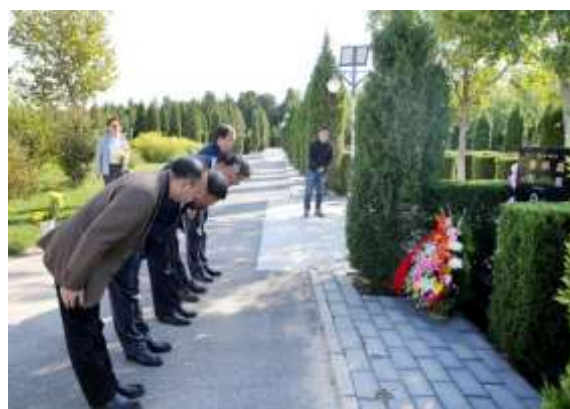
朱善璐等向李大钊先生和黄楠森先生的墓碑敬献鲜花