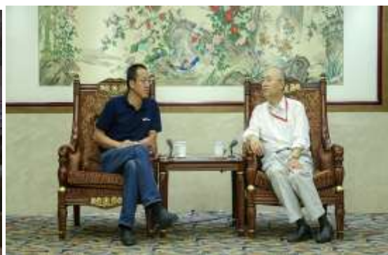
吴志攀会见俞敏洪一行

活动开始前，吴志攀在贵宾室会见了俞敏洪一行，双方就校企人才合作、人才培养战略等问题进行了深入交流。校友工作办公室主任李宇宁、学生就业指导服务中心主任陈永利出席上述活动。