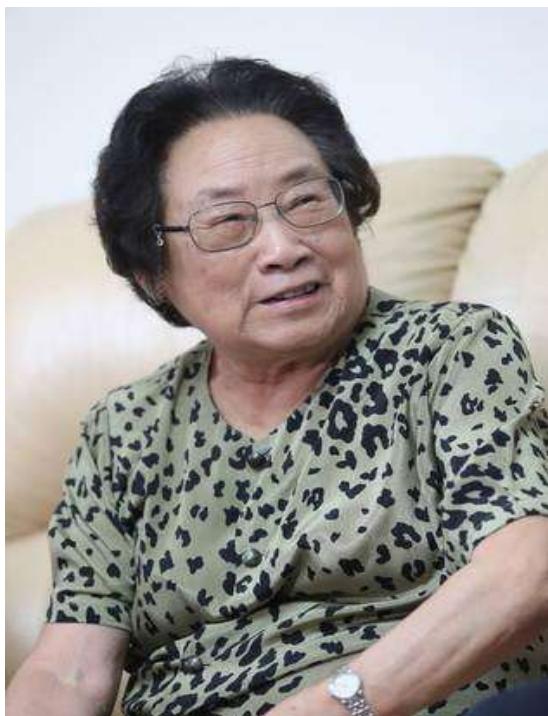
屠呦呦和大家分享了青年时期的求学经历

谈到获奖，屠呦呦深感肩上责任之重大，“荣誉越多，责任就越大，就应该做更多的工作”。屠呦呦说，青蒿素还有其他疗效有待发掘，其中治疗疟疾的机理还有待厘清，青蒿素的耐药性在不久的将来也会出现，这些问题都需要有人继续研究下去。