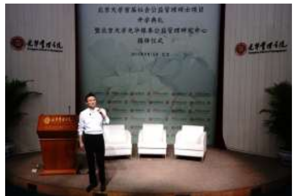
马云为新生讲授第一课

典礼上，马云通过三个事例分享了他的公益理念。他强调，企业的第一责任是创造财富、提高效率、提供就业，这是发挥社会责任的前提。公益事业跟公司一样，需要愿景、战略、组织、人才。他认为，社会公益管理硕士项目的意义正是将公益走向“效率”与“专业”，未来的公益不仅需要用善心、善意“做正确的事”，还要有善能、善力“正确地做事”。马云亲切地寄语新生，公益是马拉松，不在于你跑多远，而在于你跑到。参与公益的目的是改变我们自己，唤醒自己的内心，公益就会是一种福报，也只有改变我们自己，这世界才会有所改变。