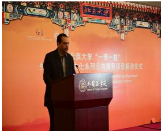
埃及驻华使馆文化参赞胡赛因·易普拉辛致辞

埃及驻华使馆文化参赞胡赛因·易普拉辛对系列课程的设置表示欢迎。他说，中国在过去30年取得了巨大成就，同时也促进了全球经济的发展。他希望中国和埃及能在目前合作的基础上，开展更加广泛和深远的合作，进一步推进双方在各方面的交流，深化友谊。