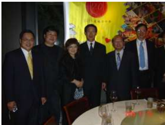
在香港与韩德民院士以及大陆台湾学者合影留念