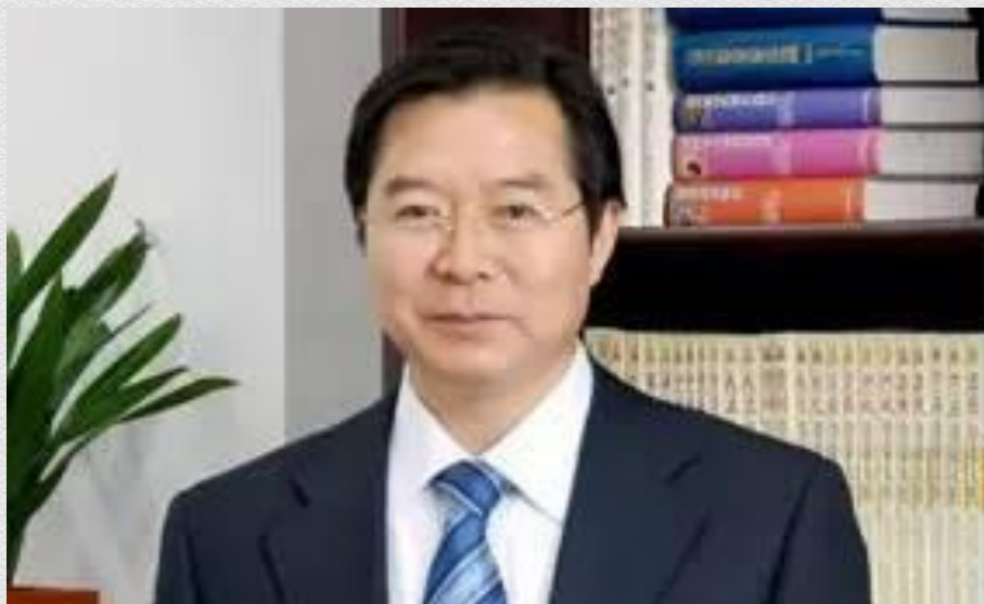
文 | 王殿军 清华大学附属中学校长