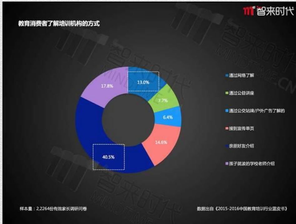
教育消费者了解机构培训的方式