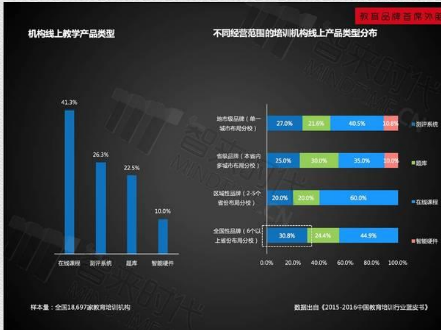
机构线上教学产品类型