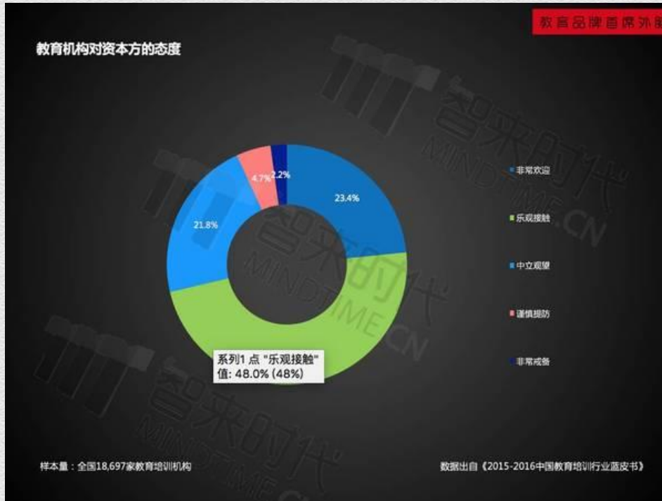
教育机构对资本方的态度