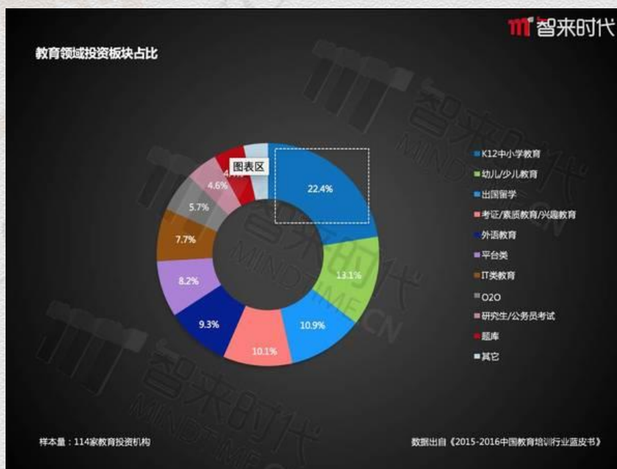
教育领域投资版块占比

智来时代通过对 114 家教育投资机构调研后发现：在教育机构所有品类中，K12 品类的机构最受资本的青睐，占比 22.4%。同时教育机构对资本方也对资本保持乐观的态度，占比 48%。