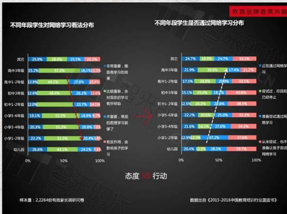
不同年龄段学生对网络学习看法分布

智来时代通过对 18,697 家教育培训机构进行调研后，呈现了教育培训机构对包括在线课程、测评系统、题库以及智能硬件四类智能硬件的使用偏好。