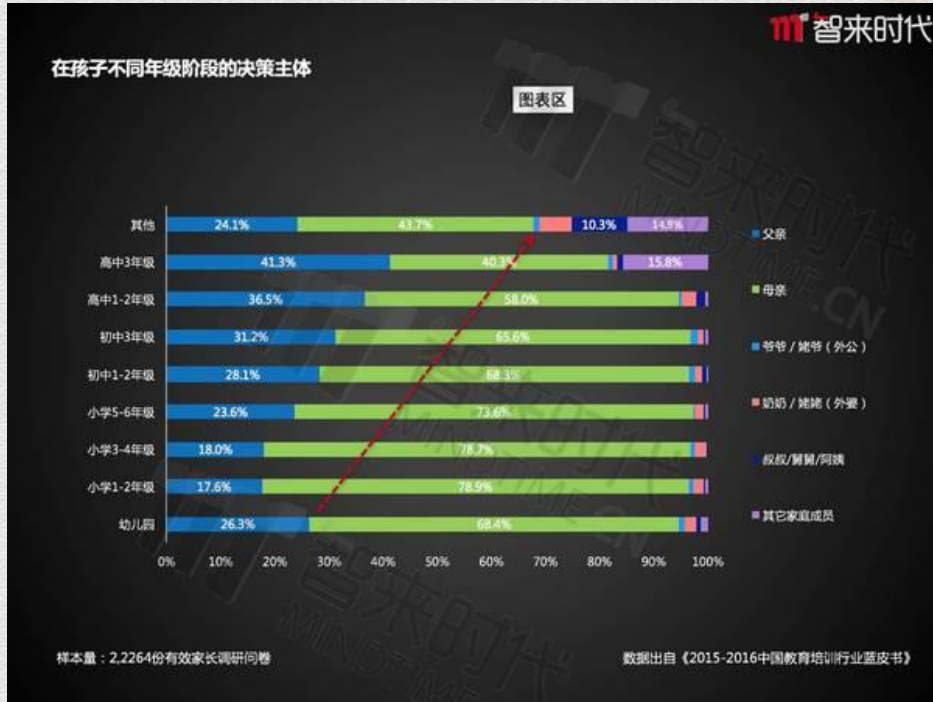
在孩子不同年级阶段的决策主体

在“消费者+教育”板块中，邢炼先生还为参会的校长们讲解了教育培训行业传播演进、客户运营漏斗内容，并分析了《2015—2016 中国教育培训行业蓝皮书》部分的消费者数据，如：不同年级阶段的决策主体、孩子参加课外培训的目的、教育消费者了解培训结构的方式等数据。