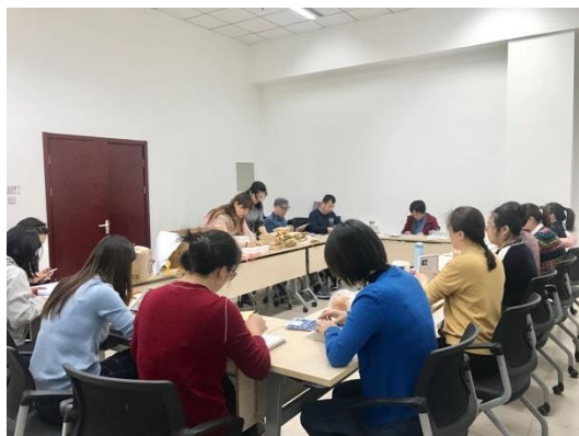
毕业证书制作现场

北京大学继续教育学历教育 2020 届春季毕业生共计 3813 人。其中，业余形式学习的 1134 人，来自学校 7 个院系、17 个专业；网络教育 2679 人，来自含校本部在内的全国 41 个学习中心。